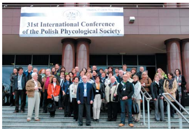
Fot. 2. Zdjęcie grupowe uczestników XXXI konferencji PTF.