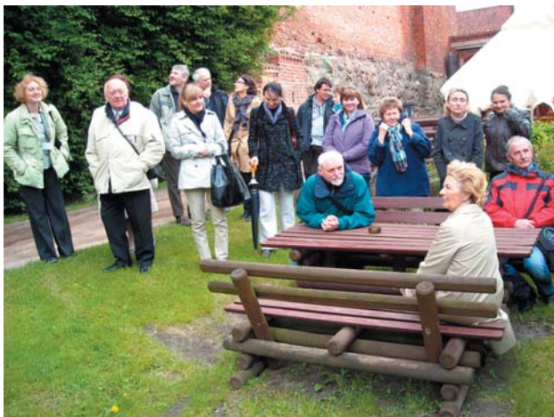
Fot. 3. Spacer po olsztyńskiej starówce.