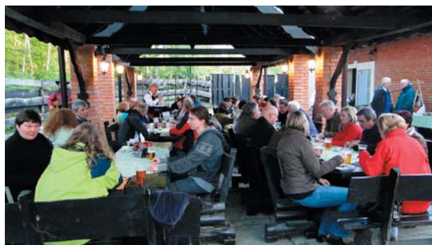
Fot. 7. Przed tradycyjnym ogniskiem.

Wieczory w drugim i trzecim dniu obrad tradycyjnie wypełniły ognisko oraz uroczysta kolacja, zamykająca konferencję. W czasie uroczystego zamknięcia XXXI Międzynarodowej Konferencji Polskiego Towarzystwa Fykologicznego wręczona została specjalna honorowa nagroda dyrektora IRS za najlepszą prezentację o środowisku wodnym oraz rozstrzygnięto konkurs na najlepszy poster prezentowany przez młodego naukowca.