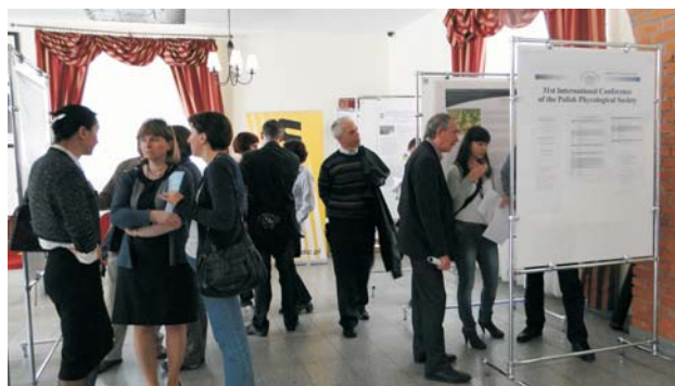
Fot. 5. Sesja posterowa.