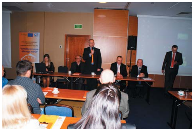
Fot. 3. Gospodarz spotkania oraz zaproszeni goście za stołem prezydyjnym.