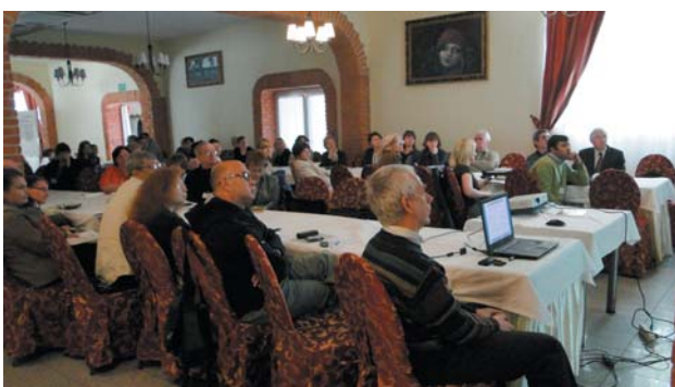
Fot. 4. Sesja referatowa.