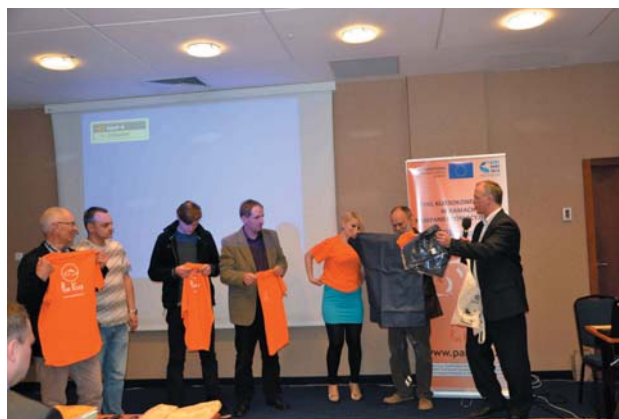
Fot. 4. Laureaci najlepszych pomysłów marketingowych w trakcie warsztatów (w tym przedstawiciele GRyb. Siemień oraz GRyb. Jedlanka).

– System certyfikacji HACCP i ISO 22000, zajęcia te prowadziła Barbara Robak, omówiła ona podstawowe założenia ww. systemów oraz dała uczestnikom zadanie podania propozycji CCP ( Critical Control Points ), czyli krytycznych punktów kontrolnych w hodowli karpia oraz w przetwórstwie ryb.