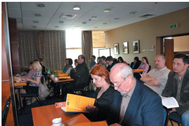
Fot. 1. Uczestnicy szkolenia w trakcie wykładów (na dalszym planie studenci WOŚiR).

Dokonano go, kierując się niewątpliwie urokami miasta (w 1997 roku toruńska starówka została wpisana na listę światowego dziedzictwa UNESCO), które jest jednym z najcenniejszych pod względem ilości zachowanych zabytków z okresu średniowiecza.