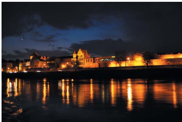
Fot. 2. Panorama Torunia widziana ze statku Wiking.