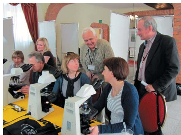
Fot. 6. Sesja mikroskopowa.