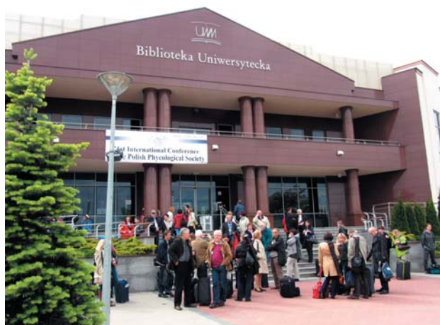
Fot. 1. Przed Biblioteką Uniwersytecką – miejscem otwarcia konferencji.

Program spotkania fykologów wypełniły trzy sesje referatowe oraz dwie sesje posterowe, w czasie których zaprezentowano 14 referatów i 55 posterów. Zgodnie z hasłem konferencji poruszały one zagadnienia taksonomii glonów znajdujących w różnych krajach świata (m.in. euglenin z Tajlandii), formowania się hormogoniów sinic, ale także szeroko pojętej ekologii glonów, a więc zależności pomiędzy typami zbiorników wodnych a strukturą planktonu roślinnego, czynników środowiskowych wpływających na zbiorowiska bentosowych